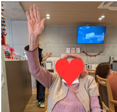
本日のベストショット